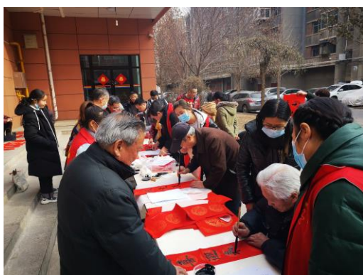
志愿者“迎新春，送春联”活动（一）