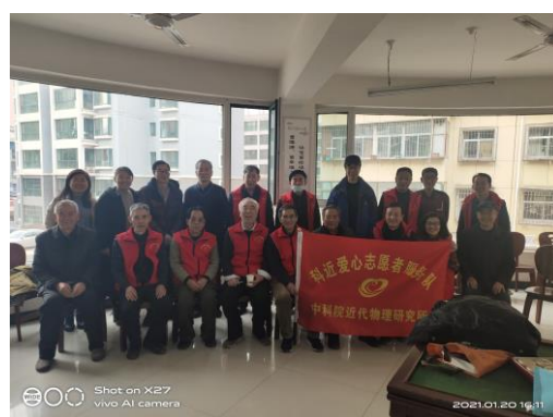
志愿者维修桌椅活动合影