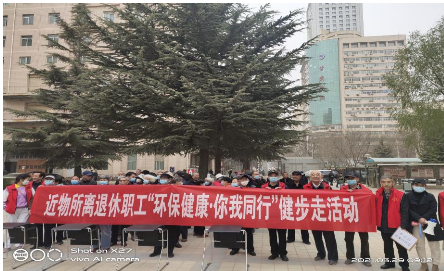
志愿者协助离退休办开展健步走活动

“科近爱心”志愿者服务开展的丰富多彩的志愿者活动受惠人数累计已近 400 人次，真正做到了暖人心、聚人心，展现了研究所浓浓的尊老、敬老、爱老情怀和我所老同志积极向上、乐于