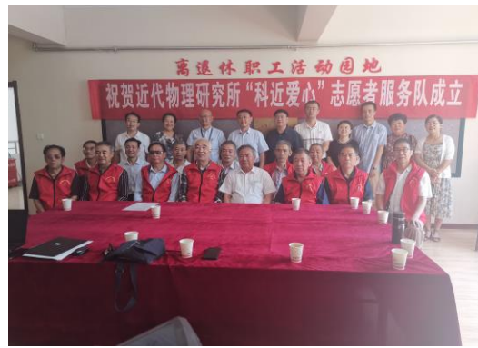
“科近爱心”志愿者服务队成立合影