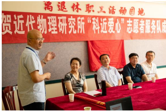
“科近爱心”志愿者服务队揭牌