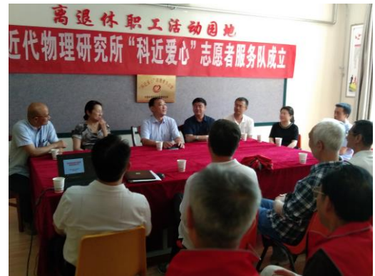
曹以玉副局长讲话

“科近爱心”志愿者服务队成立两年来，服务队的老同志们暖心舒心，志愿服务，平时嘘寒问暖有特殊困难的离退休职工，及时了解他们的生活状况和身体情况，力所能及解决他们遇到的困难，倾注了大量心血和汗水。“国庆、中秋、重阳”期间，开展“关爱弱势退休职工”为主题的志愿活动，为研究所孤寡、独居、空巢、失能老同志上门送油、米、面等三节慰问品 18 人次，解决了他们出门领取的困难，把组织和所领导的关怀送到家；志愿者不定期检查离退休职工活动室桌椅等设备是否完好，对损毁的椅子及时修理；对失能、独居等行动不便的老人，志愿者随时上门为他们理发，春节前和二月二定期开展志愿者爱心美发，为辖区离退休职工免费理发，提供便利服务，目前已开展免费美发活动 10 余场；春节前夕，服务队每年联合离退办常态化举办“迎