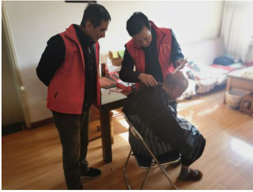
志愿者为失能老同志上门理发