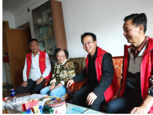
志愿者上门为独居老同志搞家政