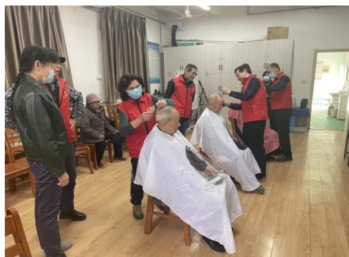
志愿者为老人义务美发