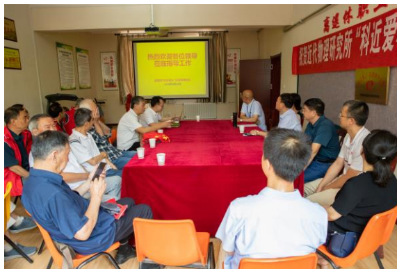
“科近爱心”志愿者服务队成立现场