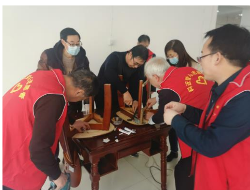
志愿者维修桌椅现场