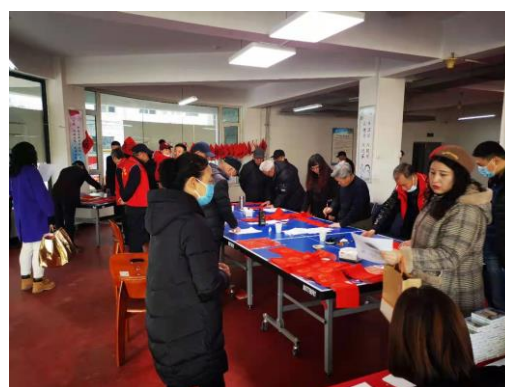
志愿者“迎新春，送春联”活动（二）