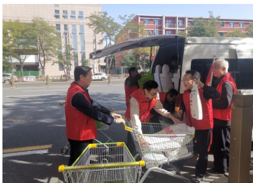
志愿者送三节慰问品

新春，送春联”活动，辖区居民可以免费领取春联，这项活动得到了辖区老同志们的广泛点赞；志愿者们还帮助孤寡老人上医院挂号3人次、协助离退办慰问老同志和组织大型活动20余次、协助退休支部收缴党费10余次。